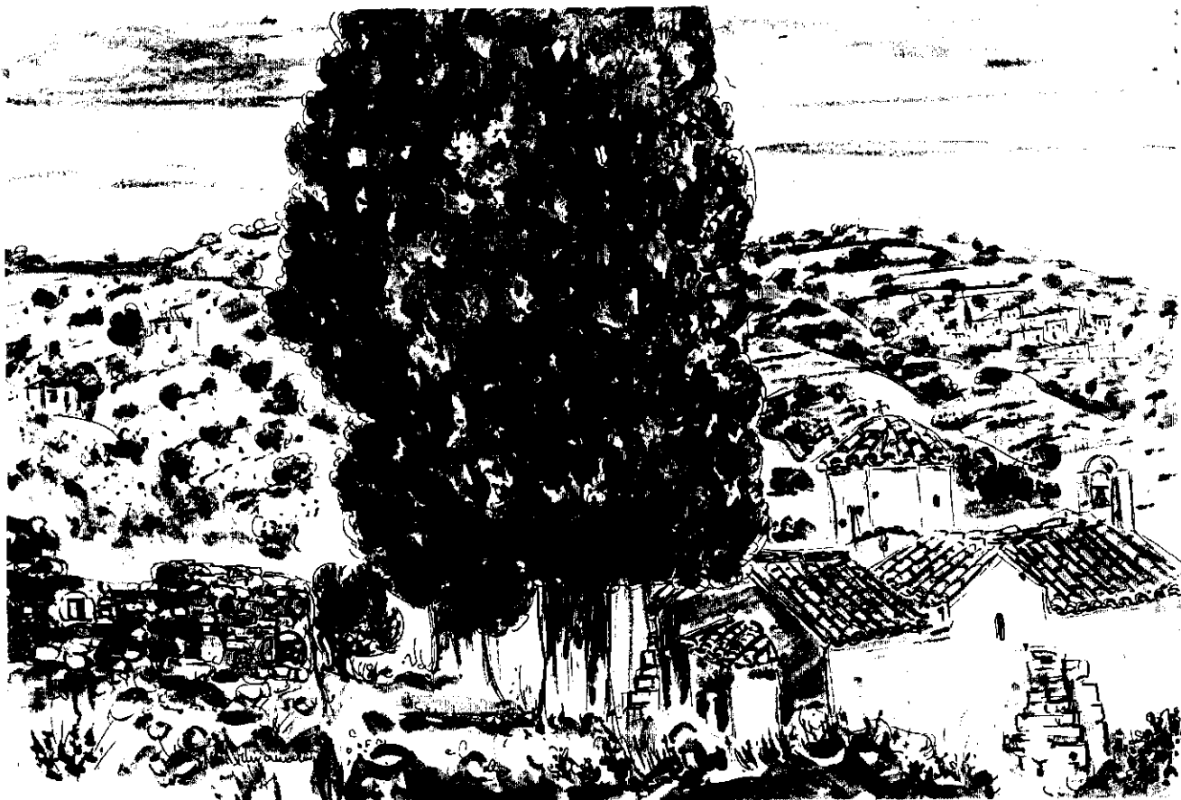
Τὸ Μοναστήρι βοήθοῦσε τὴ Σχολὴ τοῦ Ἁγίου Γεωργίου, με χρήματα καὶ δωρεὲς κτημάτων.