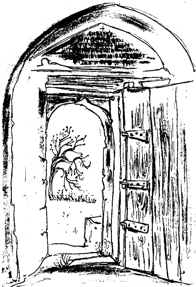
Η πόρτα τού Θεολόγου

Τό 1826 παίρνει 50 γρ. άπό διαθήκη τού Ιερομόναχου Νεόφυτου.